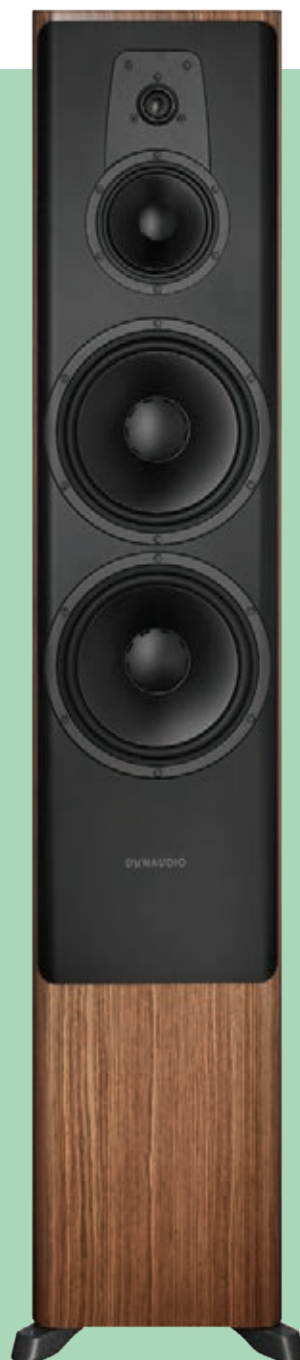
A gama Contour

gem, os países escandinavos, não espanta assim que os seus habitantes apresentem os níveis mais elevados de felicidade a nível mundial. É como se fizessem o clima rigoroso pagar juros em termos de conforto. São povos que levam o bem-estar muito a sério.